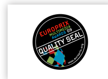
European Quality Seal

Im Bereich der Entwicklung interaktiver Applikationen wurden wir bereits mehrfach ausgezeichnet: