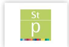
Staatspreis für Multimedia